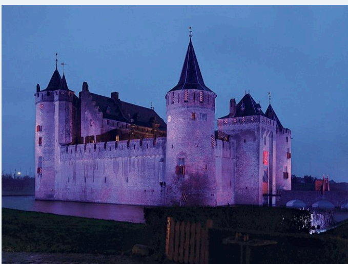
Muider slot.