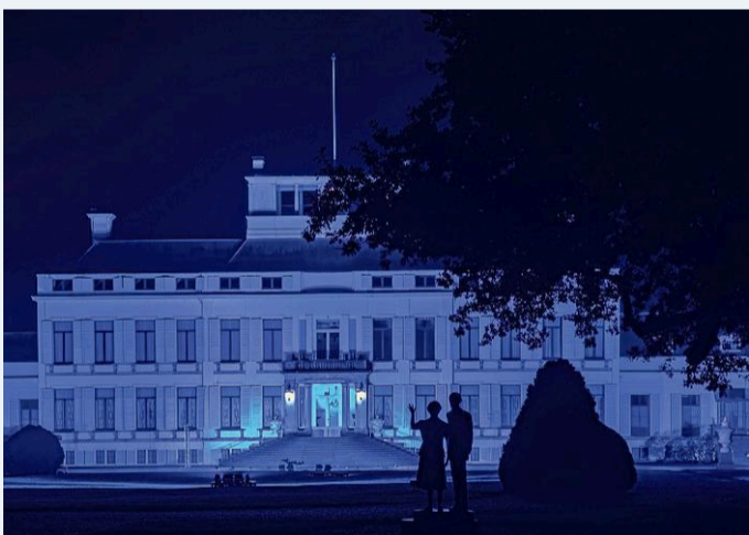
Soestdijk in Baarn.

INTERVIEW GZ-psycholoog Coen Völker deed onderzoek naar 'angst na kanker'