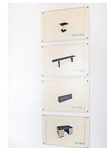
Originele Dudokschetsen hangen aan de muur.